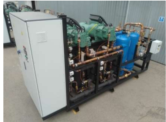
Стандартная комплектация агрегата